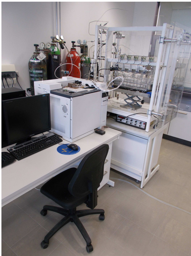
Továbbfejlesztett nagyáteresztő fotokatalitikus vizsgálóberendezés