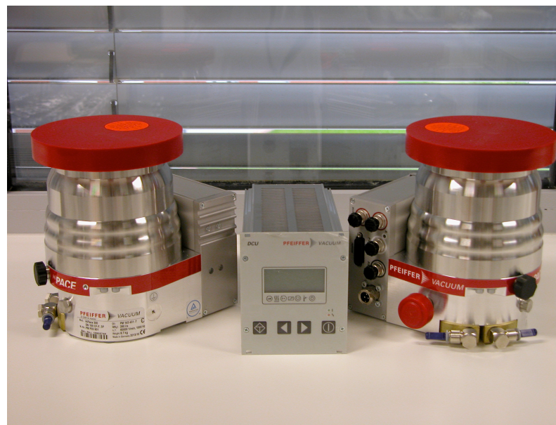
Vákuumszivattyú II., beépítés előtt