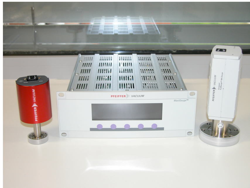
Vákuumszivattyú I., beépítés előtt